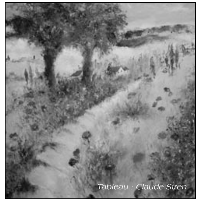
Tableau : Claude Stren